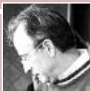
IL FESTIVAL 2010

Caro gentile amico e amica, collega, paziente, dopo la commovente esperienza dell'anno scorso vissuta col Primo Festival Cilentano dell'Omeopatia Unicista, il minimo che si poteva sperare era di rivedersi. Questo incontro tra medici, pazienti, contadini, artisti, provenienti un po' da tutta l'Italia, è stato un incontro rigenerante per tutti. Curativo, quindi! Questo mi ha convinto a prepararne una seconda edizione, della durata di una intera settimana! I primi quattro giorni sono dedicati alla scoperta dei luoghi del Cilento e della loro Anima: un'occasione splendida per conoscere e per conoscersi, per curarsi l'Anima, vivendo davvero l'Anima di una terra e di un popolo. I tre giorni successivi ci vedranno concentrati maggiormente sulla specifica tematica medica che dà il nome a questa edizione del Festival: i miasmi. Il tema di quest'anno è infatti la Malattia Cronica Costituzionale e le sue Modalità fondamentali di espressione: i Miasmi . Perché uno stesso stimolo patogeno ammalava delle persone e altre no? Perché un malato guarisce velocemente e un altro con più difficoltà? Perché un malato guarisce completamente e un altro solo fino ad un certo punto? A queste e a moltissime altre domande risponde la dottrina miasmatica delle malattie. Il terreno, la predisposizione morbosa ereditata, sotto forma di ipofunzione, iperfunzione e disfunzione, classificano ogni aspetto ammalato dell'essere umano. Da un raffreddore a un cancro, da un'ansia a un delirio.